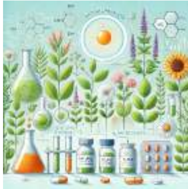
Figura 1. Da Natureza ao Laboratório: A Transformação de Produtos Naturais em Medicamentos.